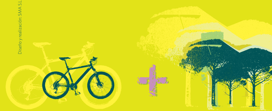
Diseño y realización: SMA S.L. Depósito legal.